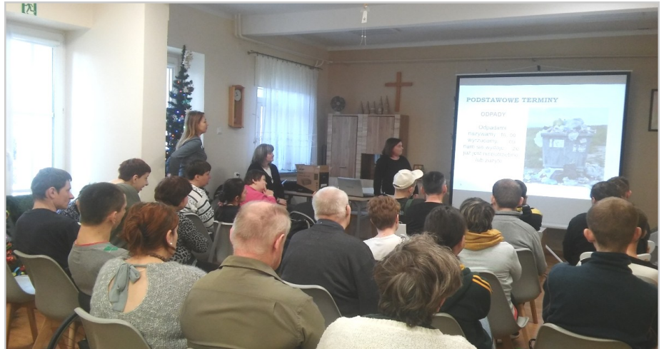
Segregacja odpadów pozwala lepiej chronić środowisko.

Głównym celem zajęć było podniesienie świadomości ekologicznej, rozwijanie postaw proekologicznych, poczucia odpowiedzialności za stan środowiska przyrodniczego oraz utrwalanie nawyków segregowania odpadów.