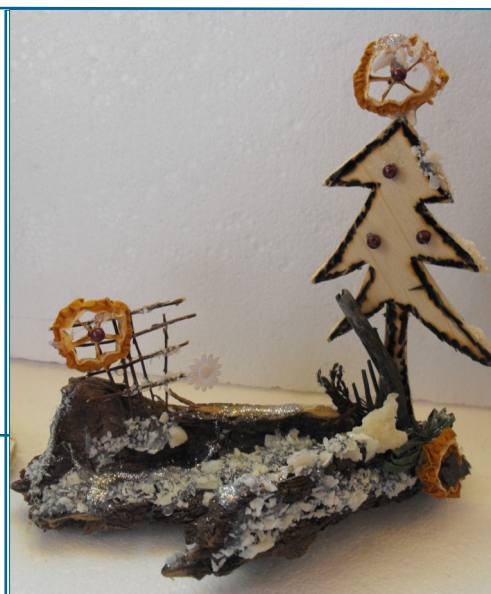
Figurka przestrzenna pt. „Pierwszy śnieg” : D. Stanisławski