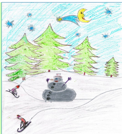
Kolorowanka pt. „Zimowy pejzaż” : K. Małycka